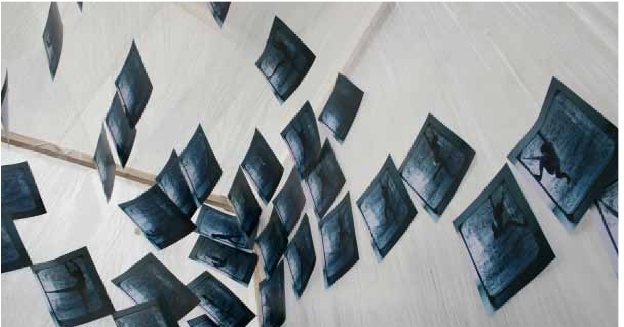
Dokumentation der Ausstellungen „How to survive“, Kunstpavillon, 2009