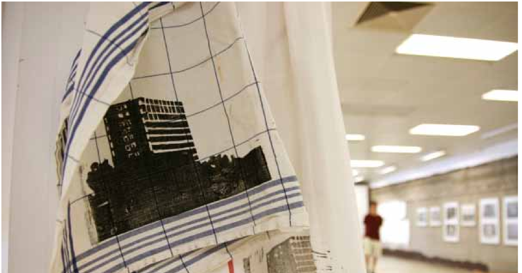
Dokumentation der Ausstellungen „ Fassaden“, Puerto Giesing, 2010